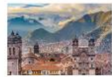
ย่านเมืองเก่าคุซโก้

** พักที่ San Agustin La Recoleta Hotel 4* หรือเทียบเท่า **