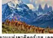
อุทยานแห่งชาติตอร์เรส เดล เพน