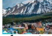
เมืองเอลคาลาฟาเต

** พักที่ Xelena Hotel 4* หรือเทียบเท่า **