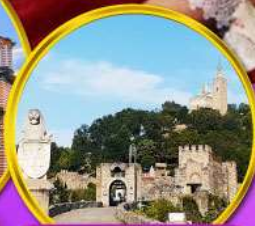
ป้อมชาเรเวทส์