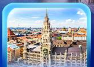
จัตุรัสมาเรียนพลัทซ์

7วัน 4คืน สายทุกจุด/เช็คอิน! AUSTRIA GERMANY SWITZERLAND