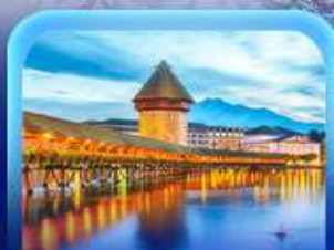
สะพานไมซ์าเปลา

7วัน 4คืน สายทุกจุด/เช็คอิน! AUSTRIA GERMANY SWITZERLAND