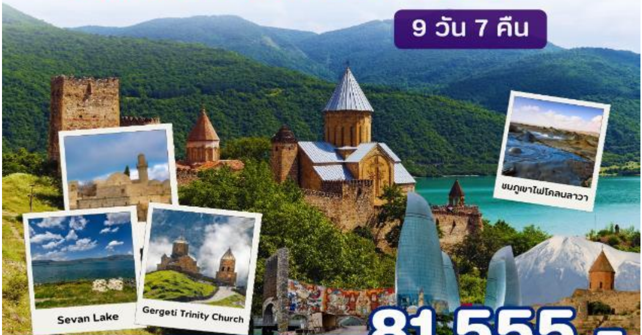
ชมภูเขาไฟโคลนลาวา