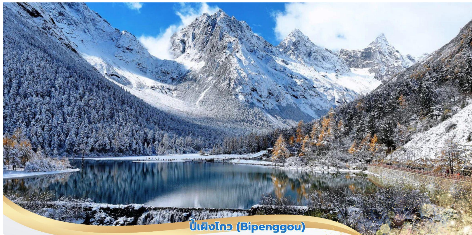
บ่เฝงโกว (Bipenggou)