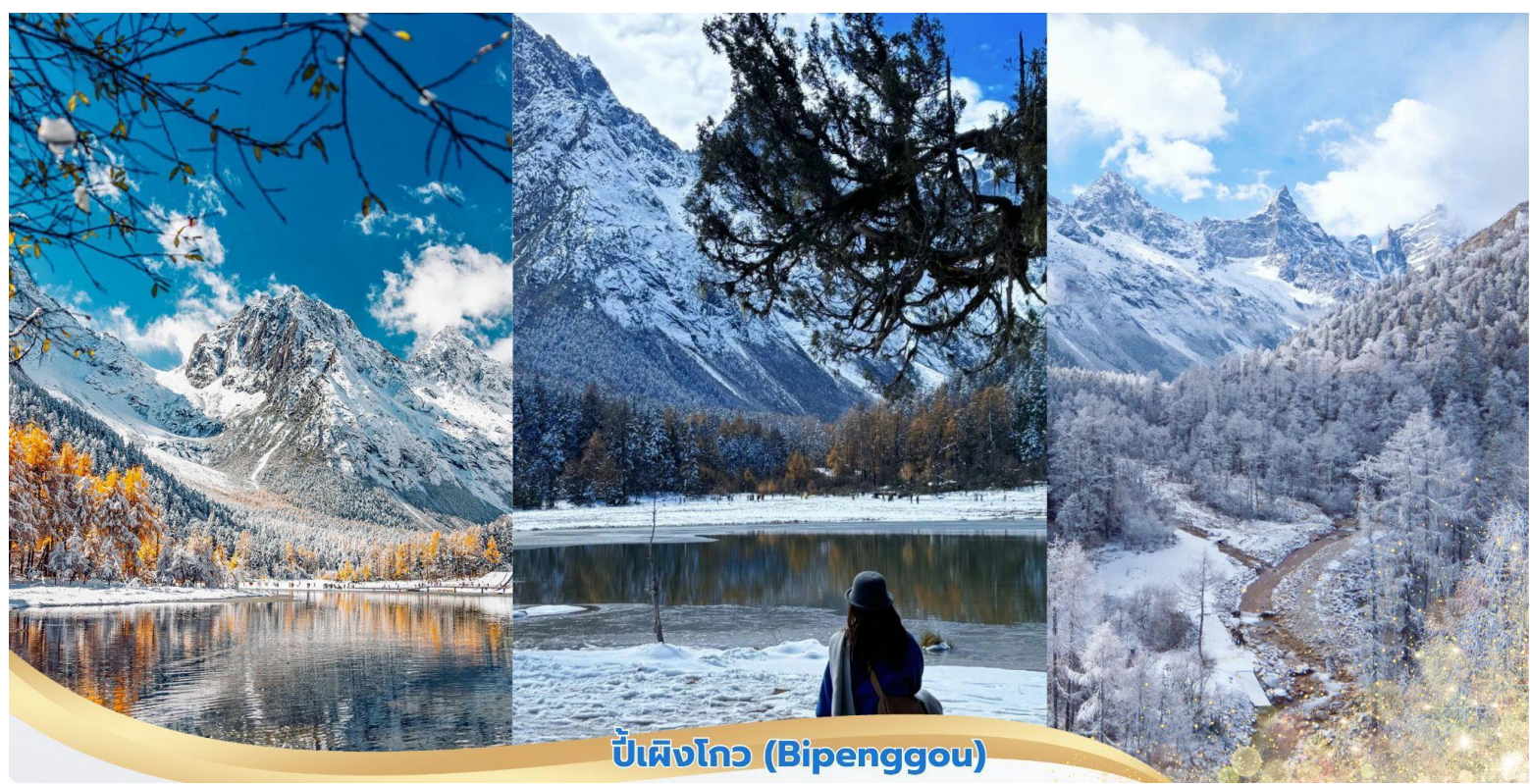
บ่เฝงโกว (Bipenggou)