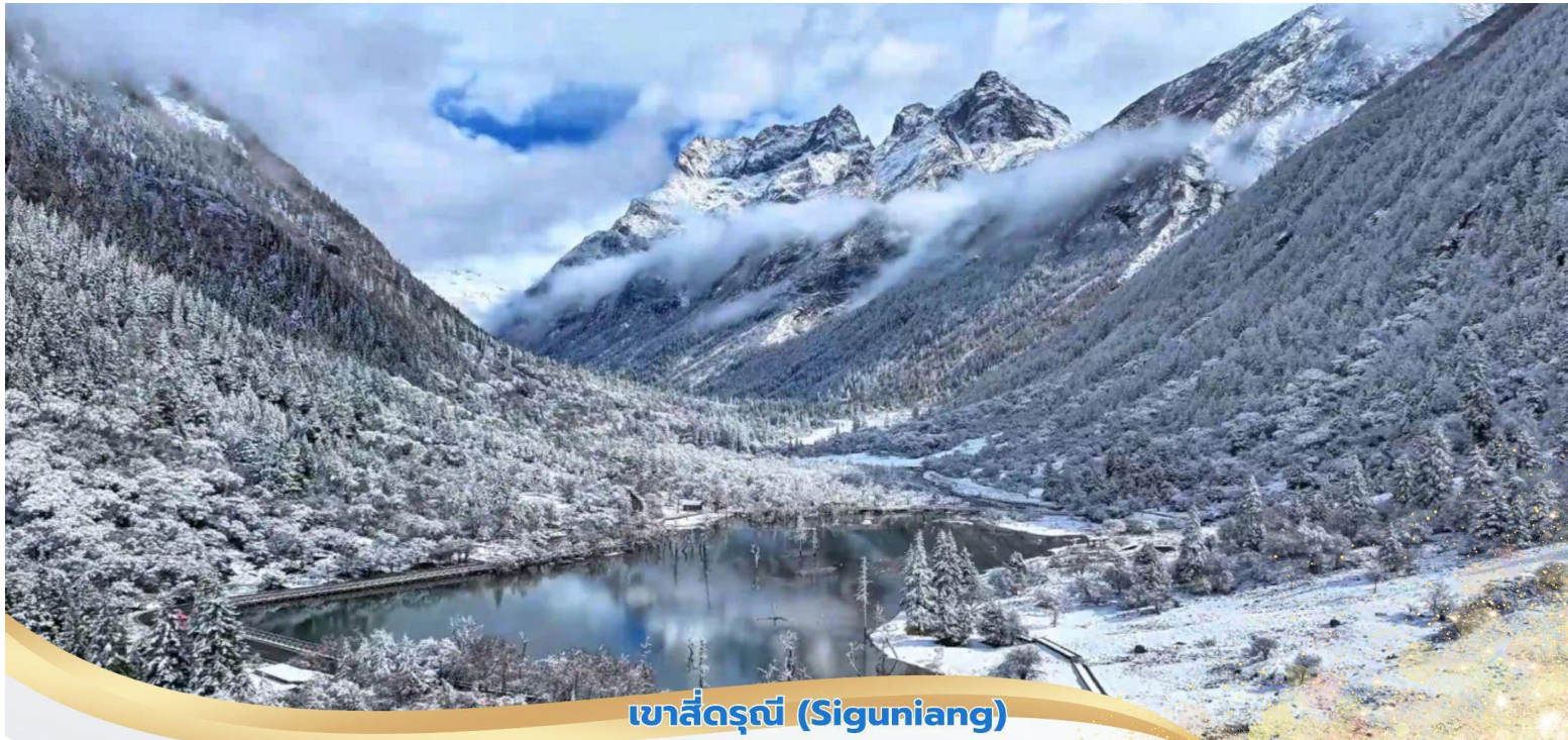
เขาสีดรุณี (Siguniang)

บ่าย นำท่านชม หุบเขาขงเจียวโกว (รวมรถอุทยาน)หรือ ลำน้ำสองสะพาน คือธารน้ำที่มีความยาวถึง 35 กิโลเมตร เส้นทางนี้เป็นหุบเขาที่ลึกที่สุดและสวยที่สุด ตลอดทางจะเห็นหุบเขา ธารน้ำ กุ้งหิน ทะเลสาบ และยอดเขารูปร่างแปลกตา มีฉากหลังเป็นภูเขาหิมะ และยังมีมีฝูงจามรีให้เห็นถือเป็นจุดท่องเที่ยวแห่งหนึ่งของเขาสีดรุณี ที่รวบรวมจุดสำคัญหลายอย่างไว้ด้วยกัน