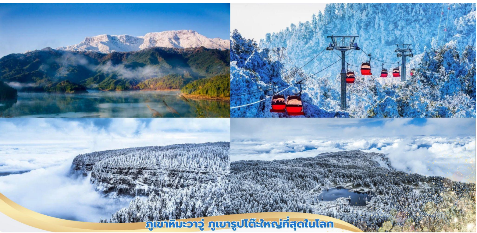
ภูเขาหิมะวาจู่ ภูเขารูปโต๊ะใหญ่ที่สุดในโลก

บ่าย จากนั้นนำท่านเที่ยวชม ภูเขาหิมะวาจู่ ภูเขารูปโต๊ะใหญ่ที่สุดในโลก นำท่านขึ้นกระเช้าขึ้นสู่ยอดเขา ตั้งอยู่ในเขตหงหย่า เมืองเหมยซาน ซึ่งเป็นบ้านเกิดของตงโป มณฑลเสฉวน โดยมีความสูง 2,830 เมตรจากระดับน้ำทะเล และมีพื้นที่บนยอดเขาประมาณ 110,000 ตร.กม. ที่นี้ได้รับการจัดอันดับให้เป็นแหล่งท่องเที่ยวระดับ AAAA แห่งชาติในเดือนมีนาคม 2019 เป็นที่รู้จักกันในนามของ โลกแห่งน้ำ โลกแห่งถ้ำ อาณาจักรแห่งดอกไม้ เพลแห่งหิมะ บ้านเกิดของเมฆ และพิพิธภัณฑ์สัตว์และพืช