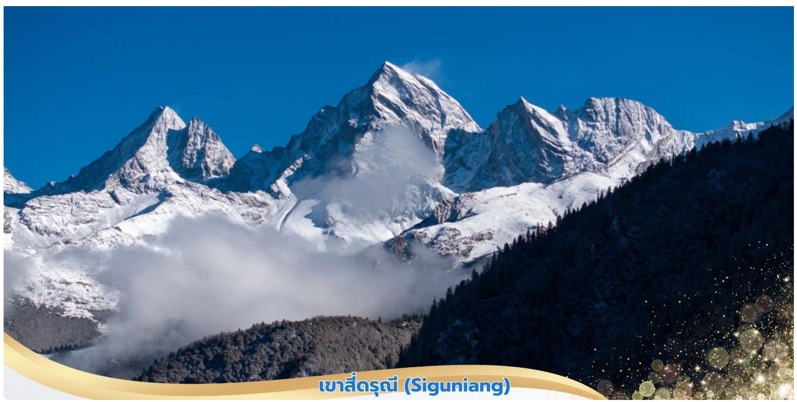
เขาสี่ดรุณี (Siguniang)